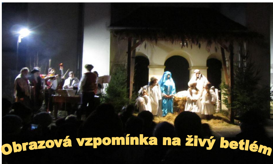
Obrazová vzpomínka na živý betlém

FARNÍ LISTY vydala Římskokatolická farnost Lipník nad Bečvou. Vychází pro vnitřní potřebu farností Lipník nad Bečvou, Týn nad Bečvou, Hlinsko za přispění firmy TRUMF International. Neprodejné!