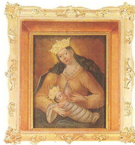
Milostný obraz Panny Marie v poutním kostele Panny Marie Sněžné v Provodově

sv. Jakuba v červenci roku 2010 a následovala neděle za nedělí a den za dnem při slavení Eucharistie v našich chrámech a kaplích. Přibyly nové ratolesti, které jste pokřtil, mladá manželství, řada dětí, které pod Vaším vedením poznávaly Pána Ježíše a poprvé přistoupily ke svatému přijímání. Kolik bylo těch, kterým jste podal Posilu v nemoci i pro cestu na věčnost a nakonec i vyprovázel na poslední cestě pozemské. Adoracím Nejsvětější Svátosti o prvních čtvrtcích a pátcích předcházely Vaše návštěvy nemocných. S úctou jste k nim spěchával se Spasitelem na srdci. Tak jste, krajan od Panny Marie Provodovské, prostoupil duchovním otcovstvím naše životy v krajině Pobečví pod Oderskými vrchy a na Záhoří pod ochranou Panny Marie Svatohostýnské. Brzy po svém příchodu jste nám prozradil, že Vaše rozhodování pro kněžství brzdily obavy z kázání. V našich farnostech po celá čtyři léta jste dostával vysvědčení s pochvalou za homilie a z nich vybírané myšlenky pro Farní listy jako „SEMAFORKY O. M.“